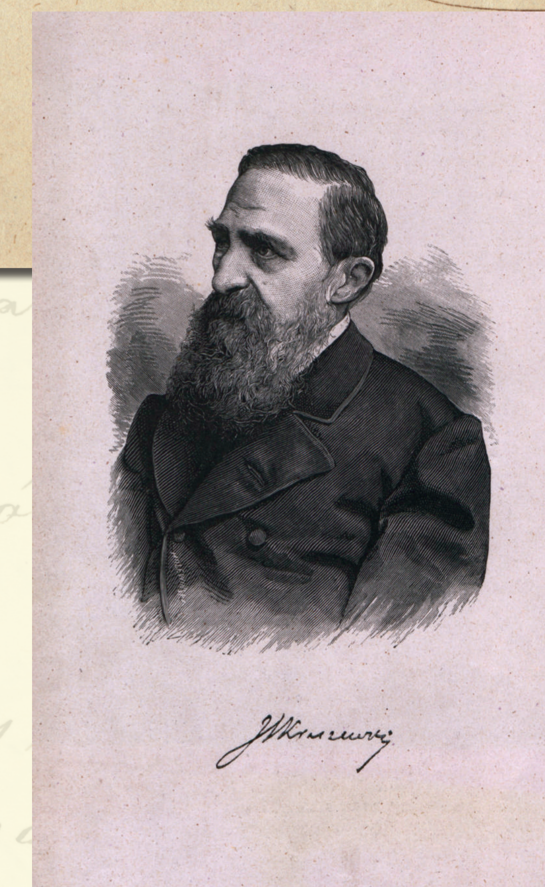
Józef Ignacy Kraszewski (1812–1887), powieściopisarz, członek korespondent TNK od 1848 roku