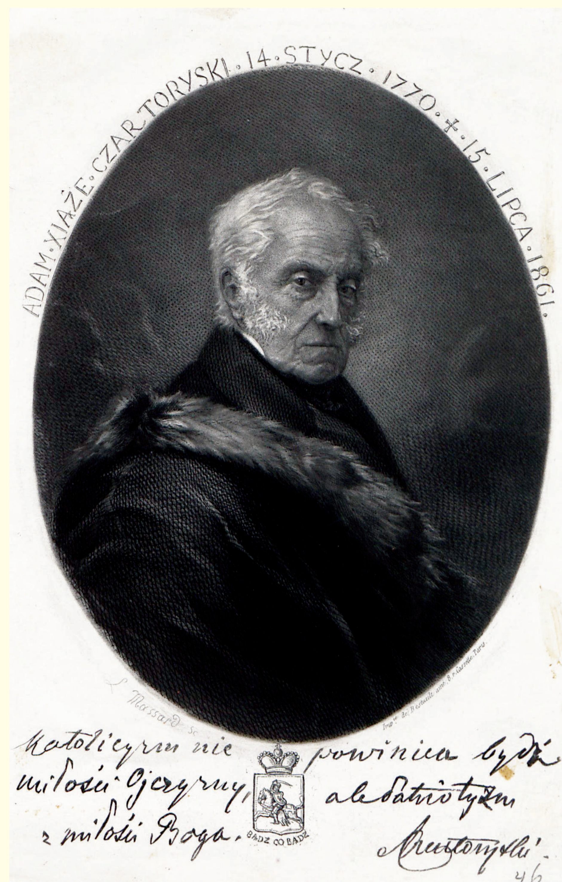
Adam Jerzy Czartoryski (1770–1861), polityk, członek honorowy TNK od 1816 roku