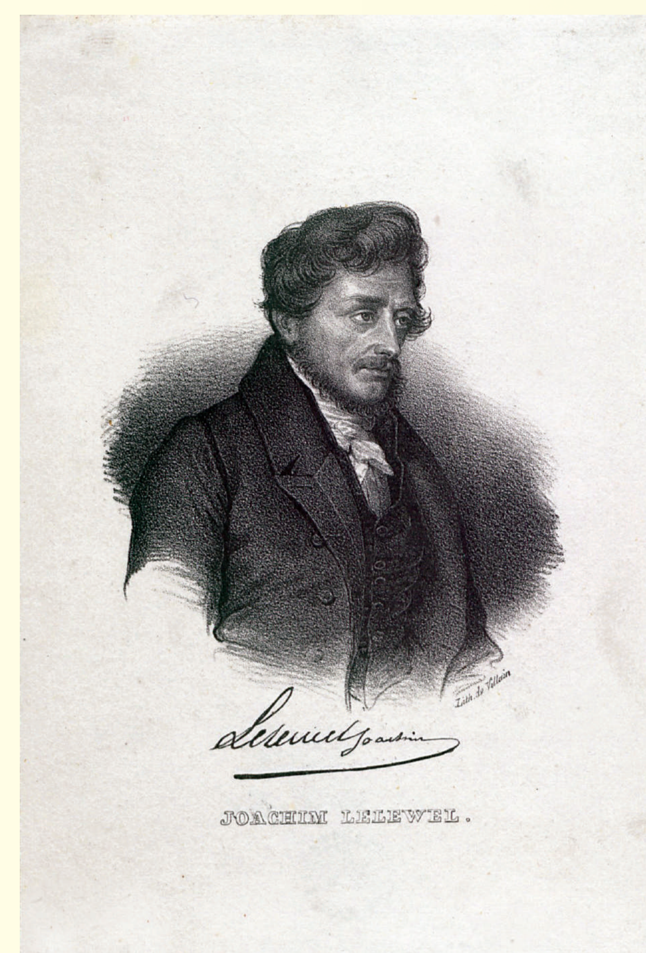
Joachim Lelewel (1786–1861), historyk, profesor Uniwersytetu Wileńskiego i Uniwersytetu Warszawskiego, członek korespondent TNK od 1828 roku